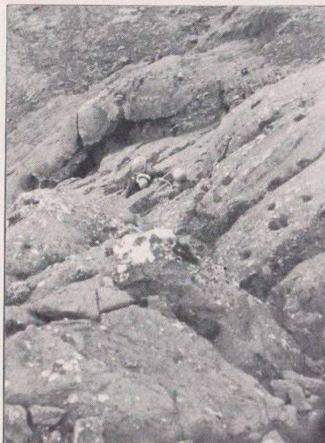
Klifur á Reykháfsleiðinni. - Ljós. Hreinn Magnússon, - sept. '78.

Reykháfnum og fyrir ofan hann en hvergi eru augljósar fleygsprungur.