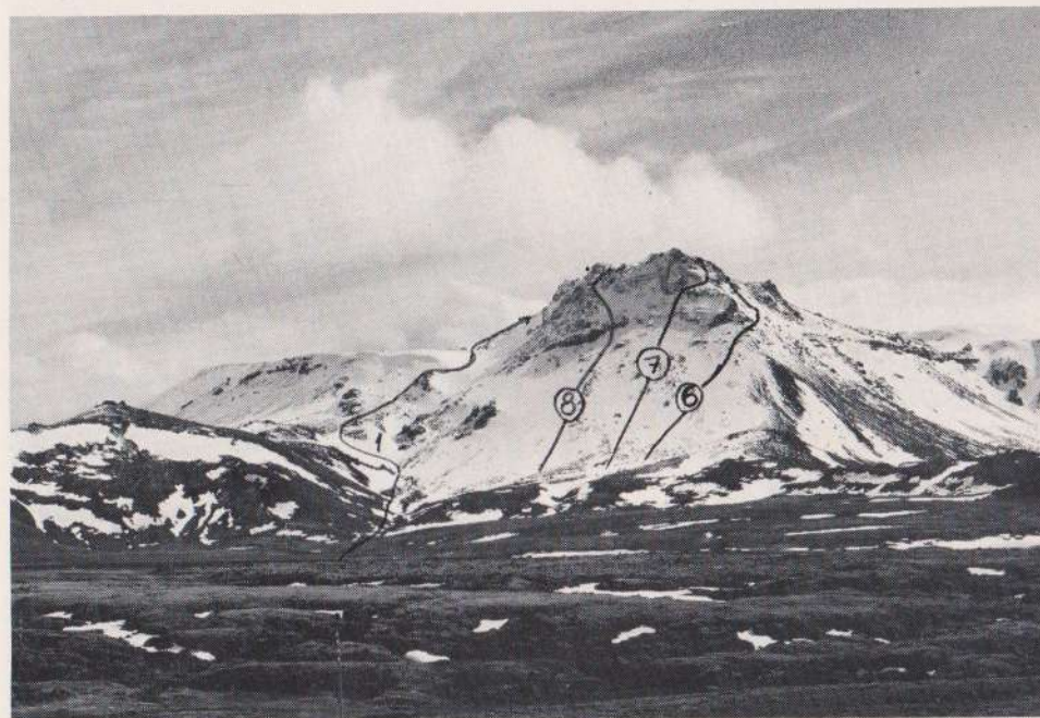
Vífilsfell séð úr vestri. - apríl '80.

og einstökum hreyfingum með nokkrum fyrirvara. Hér er um frumtilraun að ræða en reynslan mun væntanlega leiða í ljós, hvernig til hefur tekist. Einnig eru menn varaðir við því að rugla saman kletta-gráðunum og snjóklifurgráðunum.